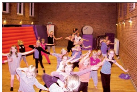
Rytme i gymnastiksalen