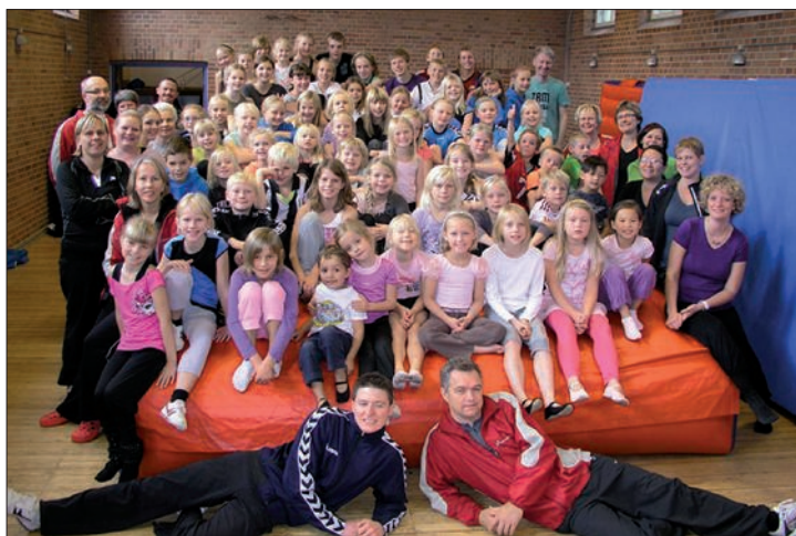
Alle deltagere på gymnastiklejren samlet i salen