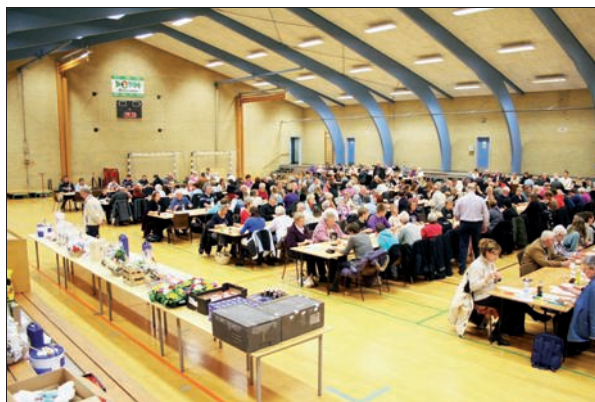
Stemningsbillede fra julebanko 2009