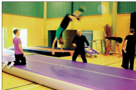
Spring i Haslev Hallen