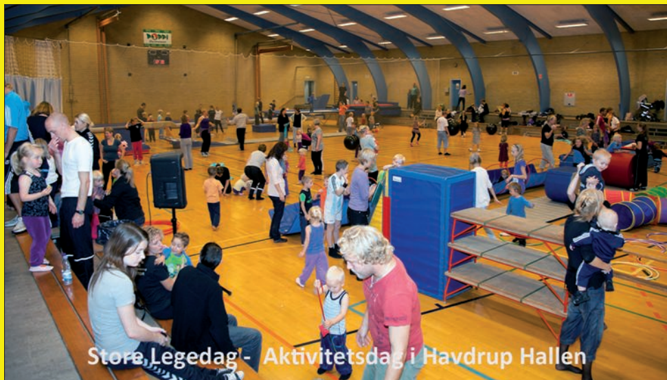
Store, Lege dag - Aktivitetsdag i Havdrup Hallen