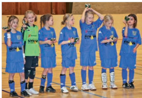
Vinder af B-finalen U9

en uafgjort og vi var klar til semifinalen. Men fødderne var ikke skruet ordentlig på, for chancerne var der, og så må vi erkende, at straffe det skal øves. For vi kom desværre ikke i finalen – ufortjent naturligvis – da vi tabte på straffe. Om eftermiddagen var det tid for 1. og 2. klasserne. Da vi primært prøver at spille "rene" årgange, har 1. klasserne det ligesom 3. klasserne det svært, da de ofte møder hold der er en årgang ældre end dem. Men som sædvanligt kæmper I som sindssyge. Og 2 uafgjorte er også to sejre. FLOT!