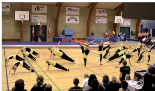
Dyb koncentration under rytmeserien