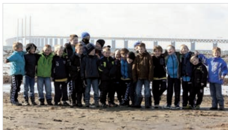
Holdet med Øresundsbron i baggrunden

Spillerne og de medrejsende familier, gik efter ankomst til spillestedet og fælles frokostspisning af egne medbragte madpakker, en tur til vandet for at lade op til dagens kampe og nyde naturen i det dejlige solskinsvejr.