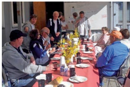
Nogle nød kaffen, mens andre var på banen