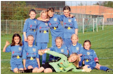
Første kamp i 7-mands. Godt kæmpet!!