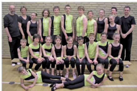
Holdfoto af deltagerne fra Super Spring

Det var en stor oplevelse for Super Spring at være deltager som ude fra kommende gæstehold.