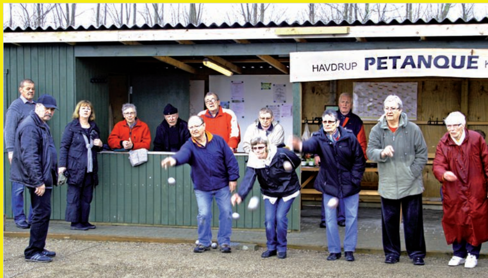
Havdrup Gymnastik- og Idrætsforening