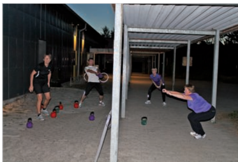
Power-Circle træning i det fri