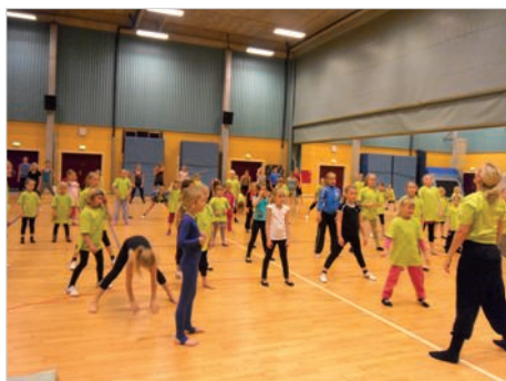
Fælles træning i Haslev hallen