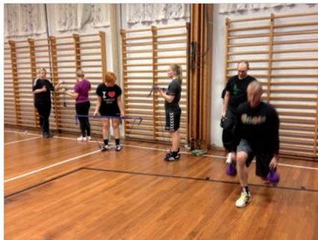
Her stationstræning - forskellige styrke øvelser og puls træning