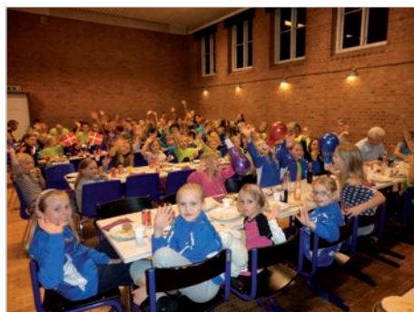
Fælles spising i lejrens sal lørdag aften