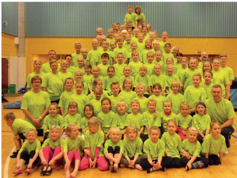
Fællesbillede i de nye Gym-Camp 2012 T-shirt