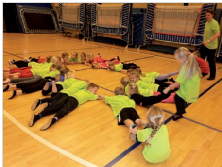
Lege hvor alle andre kan være med