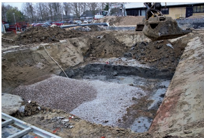
Sådan ser et hul til en springgrav ud

På www.hgi-nyt.dk findes et link til et fotoalbum med billeder fra byggeriet af Havdrup Hal 2, som vil blive opdateret løbende.