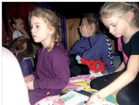
Hygge på sovesalen