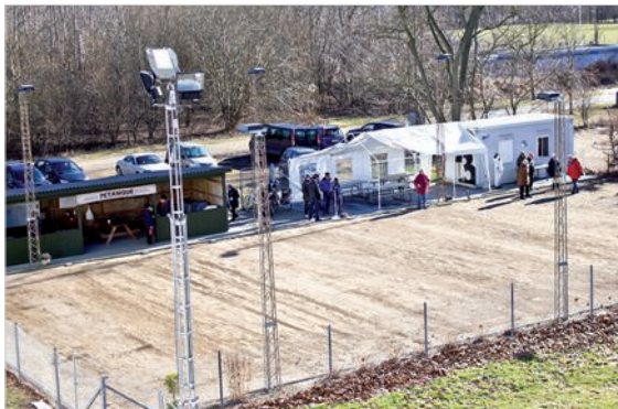
Anlægget set fra Hal 2

Petanque er en billig sport, både hvad angår udstyr og kontingent.