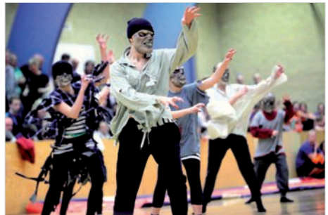
Just Dance II, med Michael Jackson masker

Præmier - Der blev ligeledes udtrukket flotte præmier på den betalte entrebillet via helt eller delvist sponserede præmier.