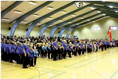
Indmarch med alle opvisningsholdene