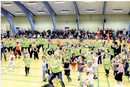
Fællesserie fra Gym-Camp lejren, ved Louise Hansen