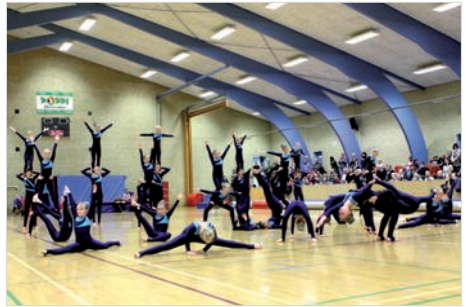
Super Spring .....