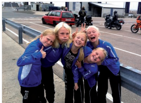
Hygge og højt humør var der masser af

Søndag stod på endnu mere spring ude som inde, inden vi alle pakkede sammen, og vendte hjem til Havdrup igen søndag aften, med en fantastisk dejlig og lærerig weekend i bagagen.