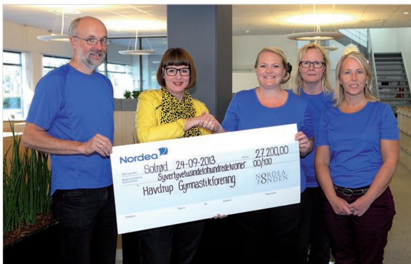
Check overrakt af Nordea, Solrød til Gymnastikafdelingen den 24. september

Jack er nu uddannet instruktør til også at kunne træne alle der har lyst til at komme i form med TRX/Jungle træning.