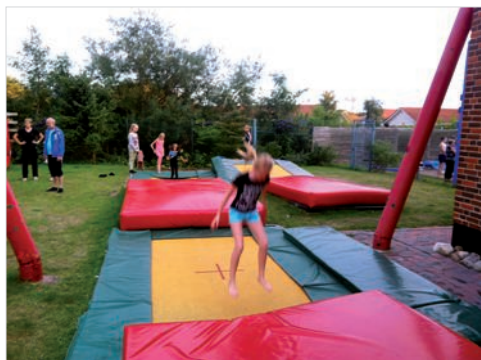
Træning på udendørsbaner og trampoliner

aftenen, stod den naturligvis også på hyggesnak på sovesalen, kage og guf.