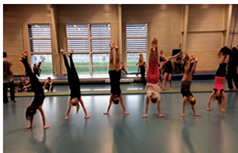
6 på stribe.....