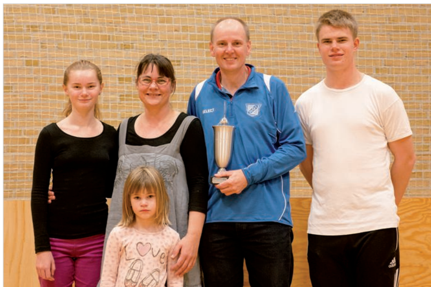
De stolte modtagere af HGI's Vandrepokal: