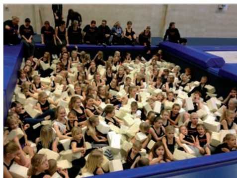
Vi mødes alle i pomfritgraven