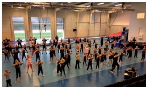
Fælles træning i Gunslevholm Idrætsefterskoles springhal & fælles spisning i møderummet