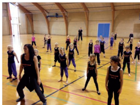
Rytme modul i den anden hal