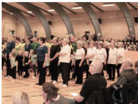
Et flot hold ikke?

Se mere på foreningens hjemmeside www.havdrupgymnastik.dk