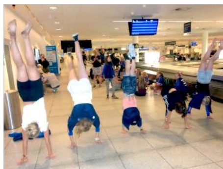
Når man venter på kufferterne i lufthavnen kan man lige så godt stå lidt på hænder