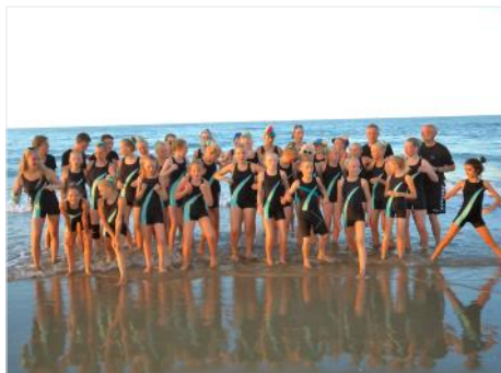
Efter sidste opvisning var der frie opstillinger og leg på stranden

En tur, en gruppe, et hold med uforglemmelige oplevelser – herunder et par enkelte af de rigtig mange billeder der blev taget på turen.