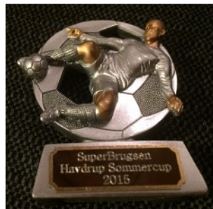
Årets personlige præmie

Fodbold blev der naturligvis også spillet masser af. I alt 110 kampe blev ledet flot igennem af 36 dommere. Der skal naturligvis også her lyde en stor tak til alle dommerne, der er med til at gøre vores stævne specielt for de ca. 550 deltagere og sikrer at tidsplanen bliver overholdt.