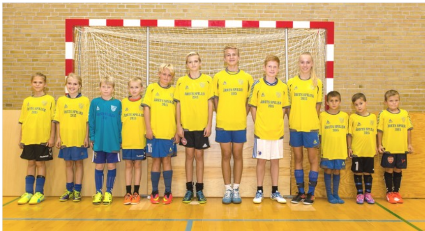
Årets spillere, Foto: Jeff Duckett

Ligesom sidste år, havde vi fodboldspillere i gang i både hal 1 og hal 2 på samme tid. Det betød at vi kunne samle alle spillerne til kåringerne i hal 1. Tak til forældre og spillere for at forholde sig i ro, så alle kunne høre og hædre de spillere, trænerne havde valgt ud.