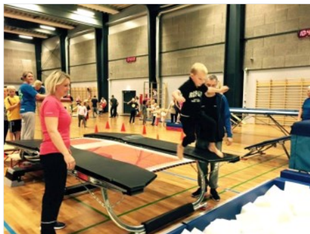
Et par billeder fra dagen