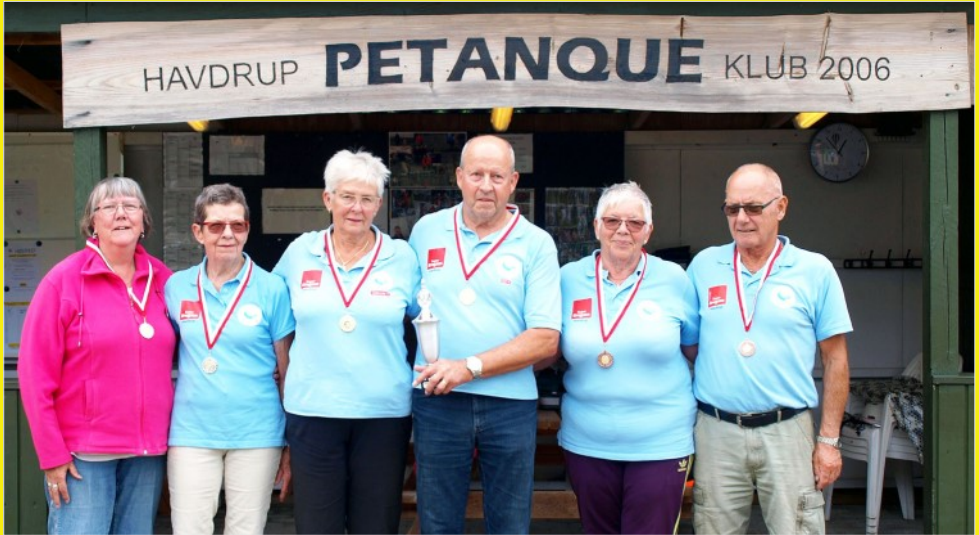
Havdrup Gymnastik- og Idrætsforening