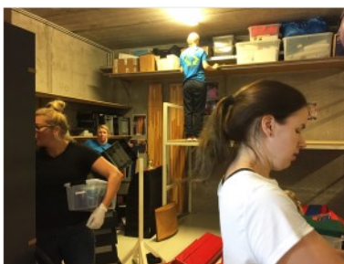
Billeder fra oprydningen