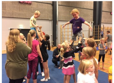
Billeder fra dagen