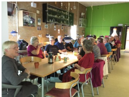
Billeder af træningen og til fælles kaffebord.