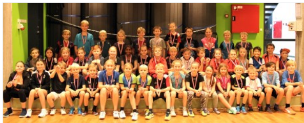
De stolte nybegyndere

Næste Badminton på Toppen stævne bliver den 18. september i Solrød.