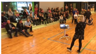
Forældre på skolebænken

I denne sæson gentager vi succesen med Badminton på Toppen. Dette stævne er et samarbejde mellem de lokale klubber Køge, Solrød, Greve, Karlslunde, Tune og Havdrup og er for nybegyndere og deres forældre.