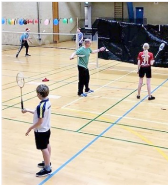
Spil med forhindringer