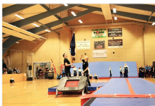
Super Spring Aspirant