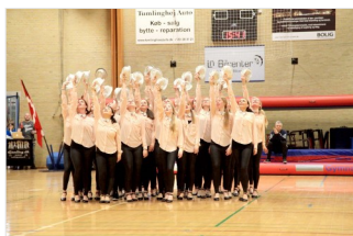
Funky Teens & Funky Ladies