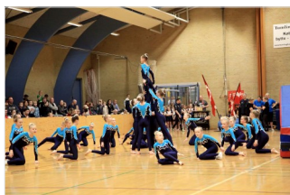
Super Spring Mini