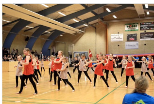
Funky Kids & Tweens