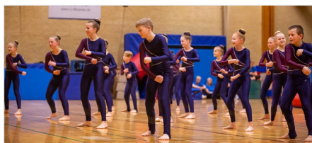
Super Spring Aspirant