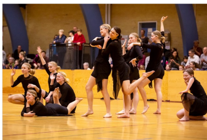
Gæsthold KB Elite