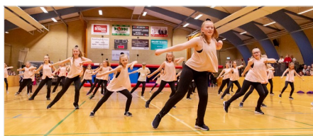
Funky Tweens & Teens